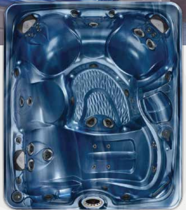
Martinique avec coque Ocean Wave