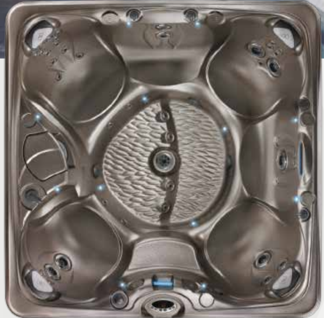
Salina avec coque Latte

Le Salina de Caldera® a la saveur du paradis retrouvé. Grâce à ses sièges ouverts à la conception ergonomique, ce spa offre suffisamment d'espace pour sept personnes. Son espace pour les pieds à deux niveaux permet de profiter du puissant jet Euphoria™ en de multiples positions. Doté de 40 jets et de 2 pompes à jets ReliaFlo™ de 2,5 CV incorporées, ce spa symbolise le paradis de l'hydromassage.